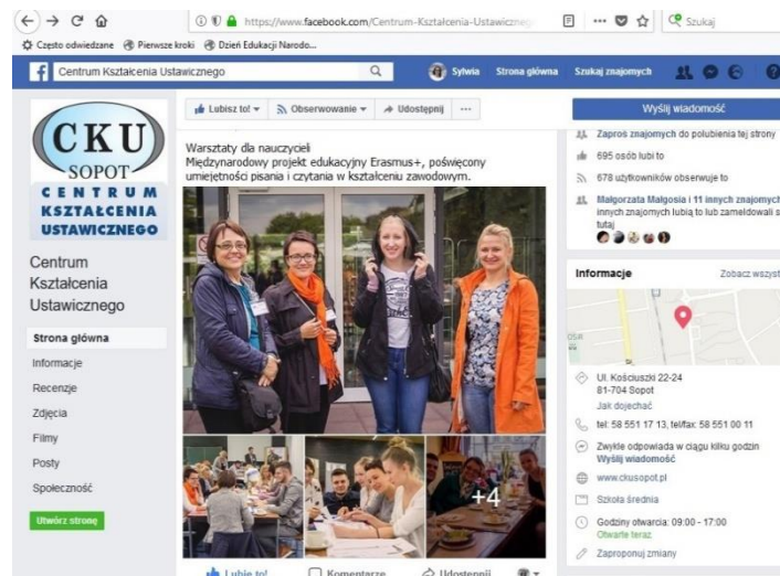
1. pilt. Töötõa kampaania näide sotsiaalmeedias, CKU Sopot

Töötõa reklaamimise viisid sõltuvad organisatsioonidest ja selle töötajatest. Töötõade kohta kättesaadav teave peaks olema piisavalt atraktiivne, et see motiveeriks õpetajaid koolituses osalema ning õpitut rakendama igapäevases töös. Koolituse korraldajad võivad tugineda klassikalistel laialdaselt kasutatavatel reklaamimeetoditel nagu kooli veebisait, sotsiaalmeedia, pedagoogidele mõeldud platvormid, plakatid või lendlehed.