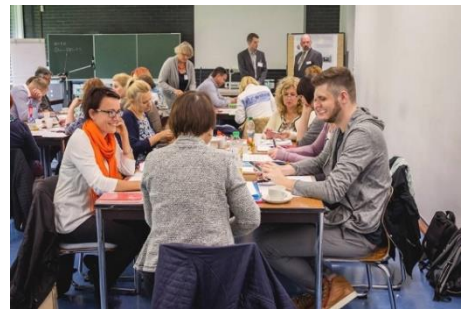
Stsenaariumi väljamõtlemise sessioon õpetajate rahvusvahelises töötoas, 13. oktoobril 2016. a, Speyer, Saksamaa

Soovituslik on tasakaalustatud ja paindlik kombinatsioon individuaalsetest, paari-, väikese grupi ja suure grupi tegevustest. Teatud tegevused (näiteks klassiruumis läbiviimine; mõtisklemine) on mõeldud individuaalsena, kuid teised jälle paaritööks – mille eesmärgiks on peamiselt õpilaste toetamine nende mõtete selgitamisel, arutledes koos teise õppuriga enne oma mõtete jagamist suure grupiga. Grupitegevused toimuvad 3-5 isikust koosnevates gruppides. Kogu grupi tegevusi kasutatakse koolitajate ettekannetes, aruteludes näitetundide lahtimõtestamisel, mõistete või ülesannete lahtiseletamisel ja töötubade tulemuste jagamisel.