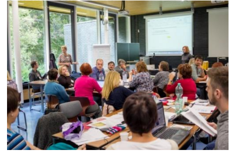
Stsenaariumi väljamõtlemise sessioonid õpetajate rahvusvahelises töötoas, 13. oktoobril 2016. a, Speyer, Saksamaa